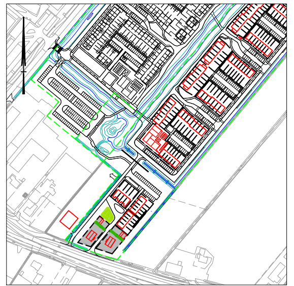
SITUATIE Schaal 1 : 5000